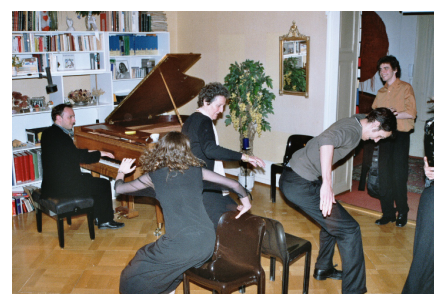
Tard dans la nuit...